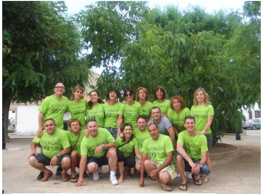
Los Festeros y las Festeras 2010

MARTES 17 DE AGOSTO: MISA EN HONOR A LOS SANTOS DE LA PIEDRA, TALLER PARA LOS PEQUES Y CHOCOLATA. CENA DE SOBAQUILLO Y CLAUSURA DE LAS FIESTAS