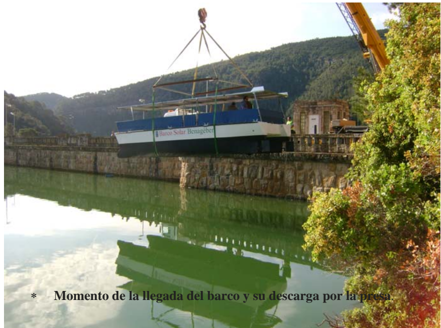
* Momento de la llegada del barco y su descarga por la presa

* Sábado, 26 de junio de 2010. Inauguración oficial del Barco Solar de Benagéber, fueron muchas las autoridades y vecinos y vecinas que se acercaron a acompañarnos en este día tan señalado para Benagéber. Todas las personas que han podido disfrutar ya de un viaje en el barco coinciden en la belleza del paisaje y de un paseo en que el tiempo parece detenerse.